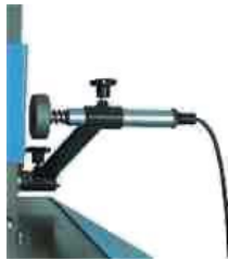
Stop de profunzime TA (A)

Pentru închiderea instrumentului de presare cu UNIMATIControl B plus, în programul 3.