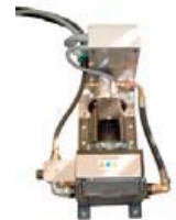
Dispozitiv racire ulei

Dispozitiv de iluminare pentru a vedea în spatele mașinii.