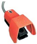
Pedala pentru picior PS

Schimbarea bacurilor de presare fără niciun pericol de deteriorare. Setați mașina pentru o poziție de schimbare fixă (automată cu Unimaticontrol B plus), folosind dispozitivul deschideți bacurile în capul staționar și strângeți instrumentul de presare pentru a îndepărta bacurile din capul staționar.